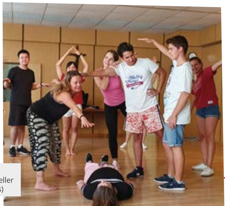
Inklusives Training von Grenzenlos – Interkultureller Austausch

Als Plan B können Rückkehrer_innen mit Behin-