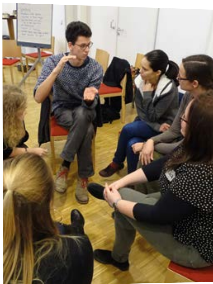
WeltWegWeiser-Training zu inklusiven Methoden

Hinweis: Es gibt in verschiedenen Förderprogrammen die Möglichkeit, zusätzliche Fördermittel für ein Reinforced Mentorship zu beantragen. Partnerorganisationen von WeltWegWeiser können solche direkt im Rahmen einer Mehrbedarfsförderung beantragen.